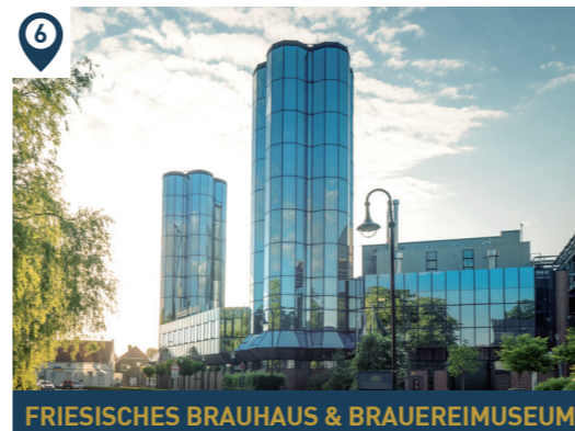
FRIESISCHES BRAUHAUS & BRAUEREIMUSEUM

Dem letzten Regenten des Jeverlandes, Häuptling Edo Wiemken, wurde von seiner Tochter Maria in der Stadtkirche ein Denkmal gesetzt. Schüler des Antwerpener Bildhauers Cornelius Floris errichteten zwischen 1561 und 1564 das Edo-Wiemken-Denkmal. Es gilt als ein bedeutendes Beispiel später niederländischer Renaissancekunst.