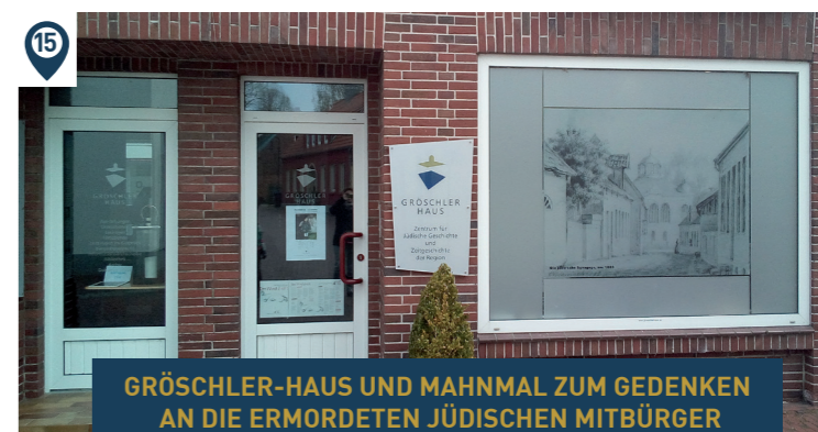
GRÖSCHLER-HAUS UND MAHNMAL ZUM GEDENKEN AN DIE ERMORDETEN JÜDISCHEN MITBÜRGER

Telefon 04461 918484 // www.ofv-112.de/museum